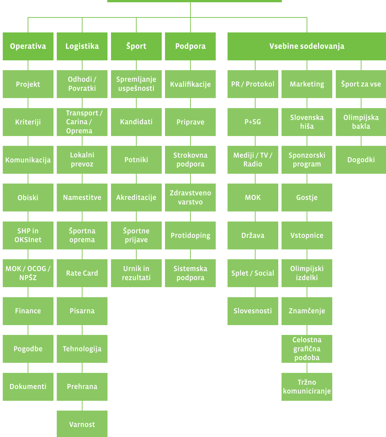
Shema vodenja projekta (pred in po igrah)