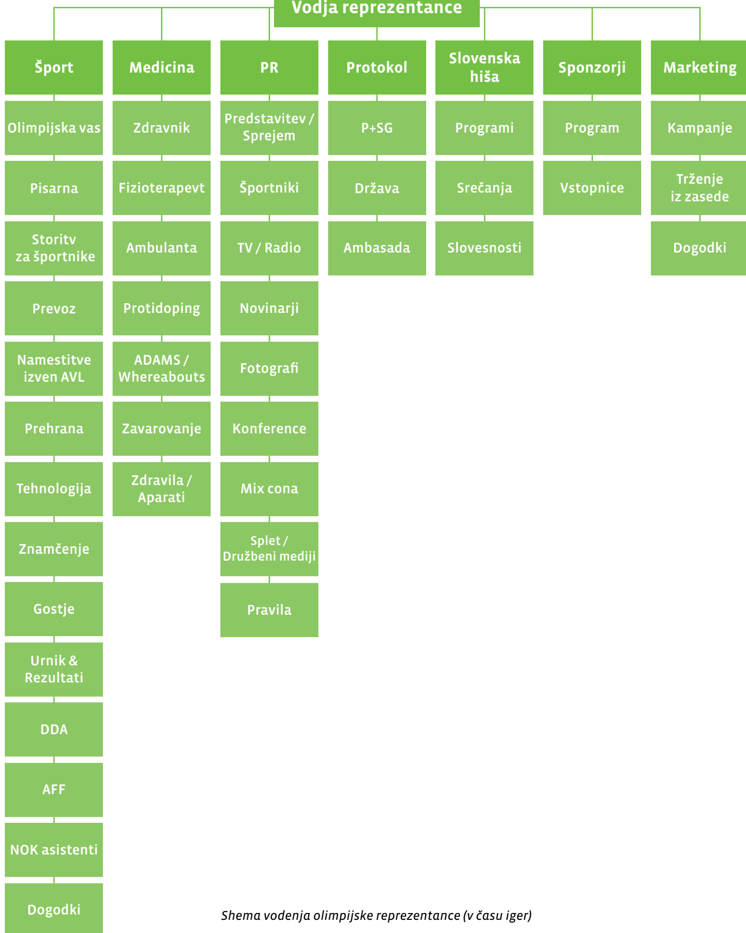
Shema vodenja olimpijske reprezentance (v času iger)