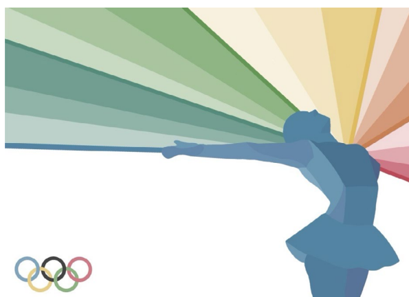
Primeri zmagovalnih plakatov

Olimpijski plakat je prepoznaven projekt Olimpijskega komiteja Slovenije, saj ima s pomočjo sodelujočih partnerjev (Europlakat) izjemno vidnost med prebivalci Slovenije.