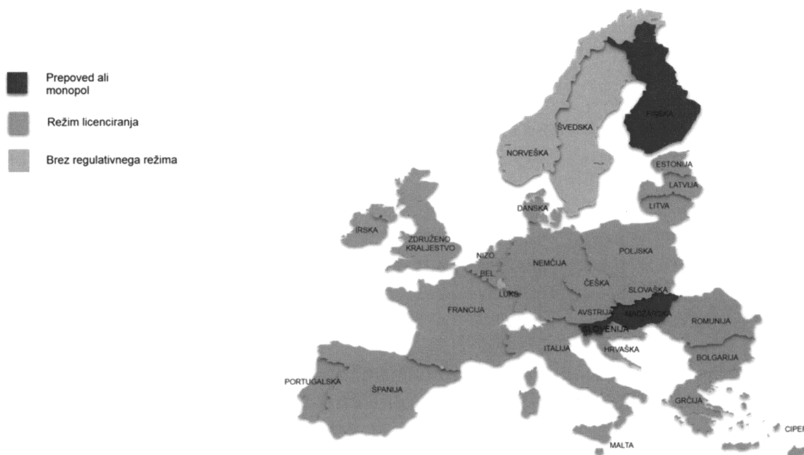
Slika 1: Pregled ureditev prirejanja športnih stav v EU/EGP